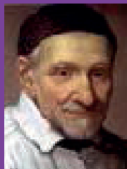
Vinzenz von Paul (1581-1660)

Die Vinzenz-Konferenzen waren die erste größere Laienorganisation in der katholischen Kirche